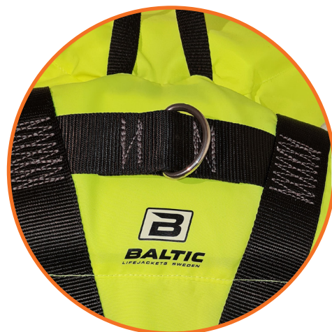
D-Ring på ryggen